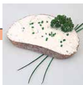
Frischkäse auf Brot